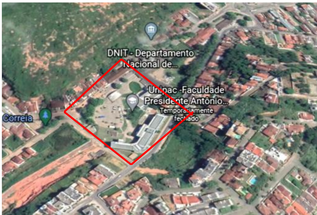
Figura 1 – Localização área da UNIPAC

Para a realização do estudo, considerou-se a Universidade ALFA UNIPAC de Teófilo Otoni, instituição que oferece a etapa de ensino superior e tecnológico localizada na cidade de Teófilo Otoni, endereço Rua Engenheiro Celso Murta, 600 - Olga Correa, com as coordenadas de latitude e longitude 17^{\circ}52'22.6''S e 41^{\circ}30'43.9''W , com área total de 2.619,23 m 2 .