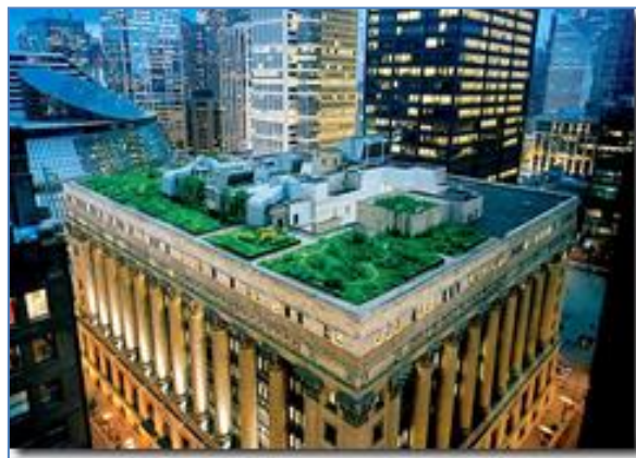
Figura 7 – Telhado verde, prefeitura da Capital Paulista

Pode-se destacar no Brasil, o maior telhado verde é o da prefeitura do estado de São Paulo.