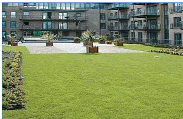
Figura 5 –Telhado Verde Semi-intensivo

O telhado verde semi-intensivo, por ser constituído de uma camada de substrato mais profundo em relação ao modelo extensivo, propicia o cultivo de plantas diversificadas, tais como herbáceas, arbustos ou até mesmo plantas lenhosas, que possuem crescimento médio (HENEINE, 2008).