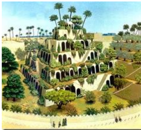
Figura 1 – TelhadoVerde -Jardim Suspenso na Babilônia

Originalmente, o telhado verde, ou eco telhado por alguns autores assim chamado, teve suas primeiras apariçõesna antiga Mesopotâmiahá 600 anos a.C, atual Sul do Iraque, e na Babilônia. E ficou conhecido como jardins suspensos da Babilônia (BUENO, 2010).