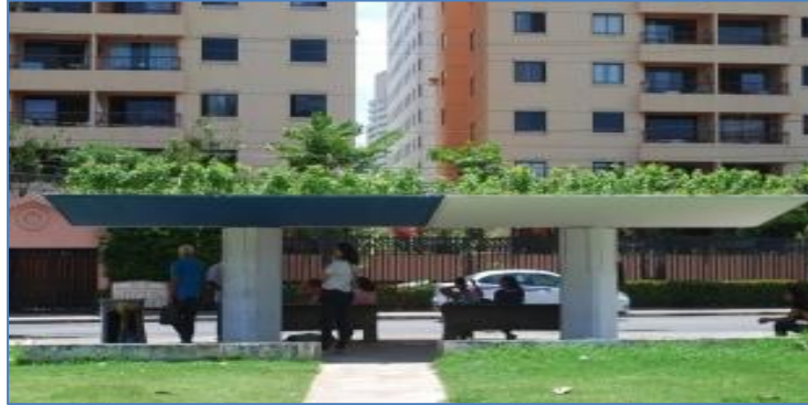
Figura 9 – Telhado Verde – Ponto de ônibus no bairro Stiep, na Capital de Salvador-BA

proporção, vinculado a uma caixa de retenção de água da chuva.(RAFAEL FAUSTINO, 2018)