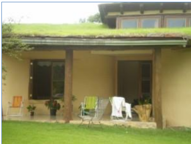
Figura 6 – Telhado Verde de Construção Extensiva em Sarandi-RS

Esse tipo de cobertura, tem por características, as camadas, menores que 20cm, e diferente da intensiva, utilizam espécies de vegetação de pequeno porte, que necessitam de pouca ou nenhuma manutenção, onde existe preocupação maior na fertilização e irrigação, até o momento em que as plantas se estabeleçam. (CORREA; GONZALES, 2002).