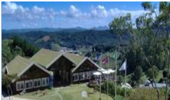
Figura 2 – Tellhado Verde - Rancho em Pedra Azul-ES

foi implantando em 1998, em Pedra Azul, no município de Domingos Martins, na região Serrana do Estado. Hoje, o rancho Fjordland, localizado na região, referência em trilhas e turismo ecológico e famoso pelas Cavalgadas Ecológicas, possui quase todas as suas instalações com o ecotelhado. (LOYOLA, 2011).