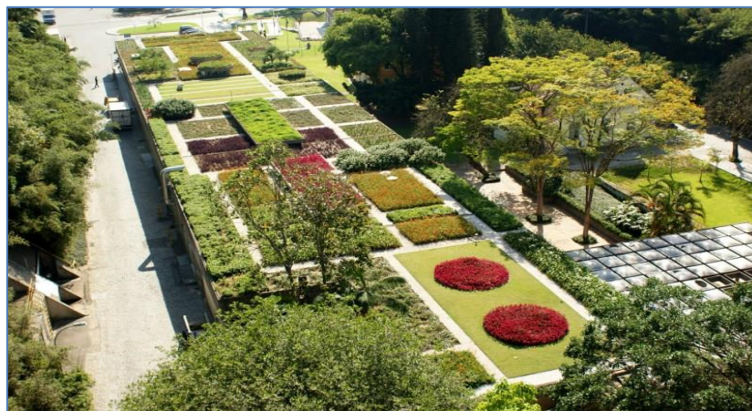
Figura 8 – Telhado Verde - Telhado Verde na sede da Cia. Hering, em Blumenau-SC

Em Blumenau, Cidade de Santa Catarina, foi instituída a Lei Complementar 1.174/2018, esta lei complementa o Código de Edificações do Município de Blumenau (Lei nº 1.030/2015), dispondo sobre a utilização do uso de coberturas verdes em edificações.